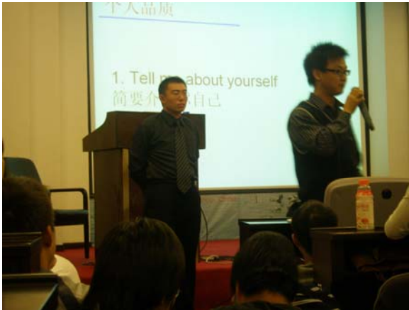
吴老师为浙江大学全校师资及学生干部做内训