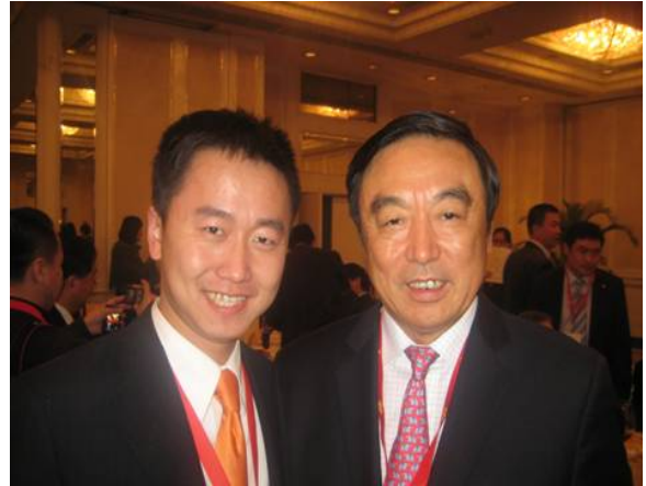
王总与招商银行马蔚华行长共同出席活动