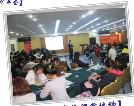
【赢鼎教育的课堂现场】