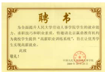
中国人民大学为赢鼎教育颁发聘书