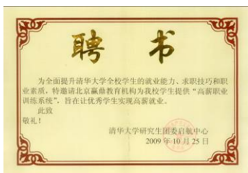
清华大学为赢鼎教育颁发聘书

作为中国高薪职业教育的第一品牌，赢鼎教育已经受到了全国众多高校的高度认可，收到了来自清华大学、北京大学、中国人民大学、浙江大学、吉林大学等高校的聘书，为其全校师生开展高薪职业理念教育。