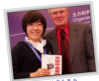
【赢鼎教育会员与 世界职业规划之父John · Krumboltz教授】