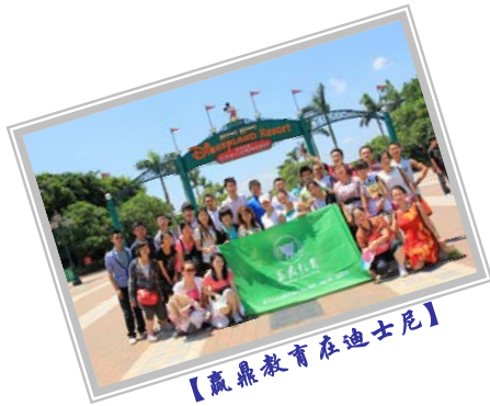
【赢鼎教育在迪士尼】