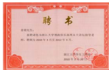
浙江大学为赢鼎教育颁发聘书

赢鼎教育 2010 年隆重推出新书《大学毕业年薪 10 万》，该书以独特的视角全