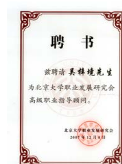
北京大学为赢鼎教育颁发聘书