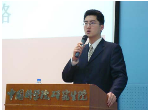
中国科学院研究生院邀请赢鼎教育进行授课