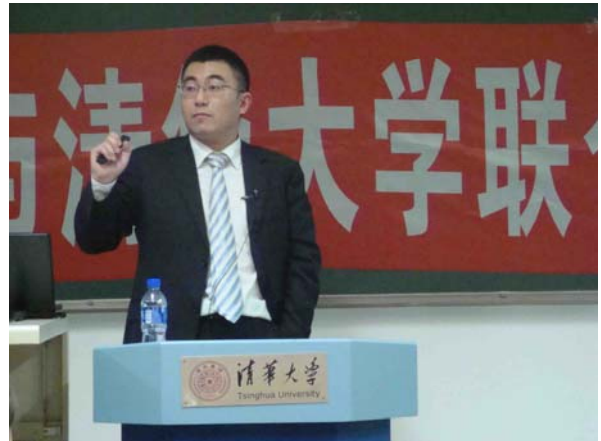
吴老师在清华大学进行大学生涯规划培训