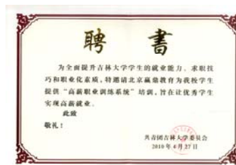
吉林大学为赢鼎教育颁发聘书