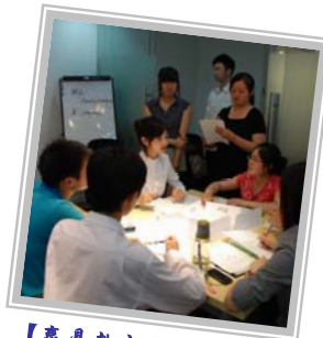
【赢鼎教育会员分享会】